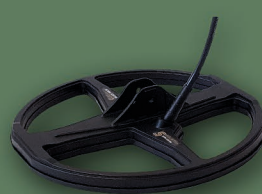
24 cm 2D Fighter