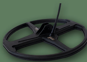
33 cm 2D Fighter