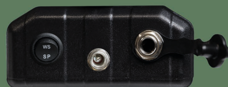
Bateriový box s přepínáním provozu na sluchátka nebo reproduktor