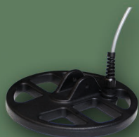
17 cm 2D Spider