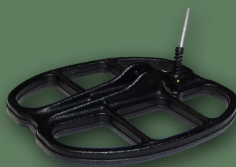
30x25 cm 2D