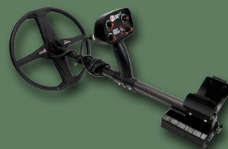
LP Zero 33 WS II ve složeném stavu

Nově vylepšené vodící tyče z kvalitnějších materiálů (pro celou řadu ZERO)