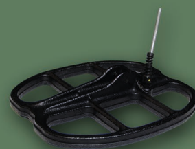
25x23 cm 2D