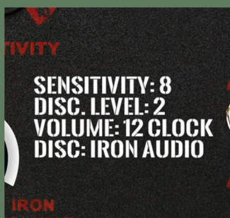
Návod na ovládacím panelu