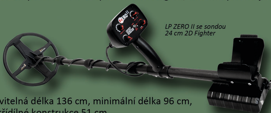
LP ZERO II se sondou 24 cm 2D Fighter

LP ZERO II je detektor, který zvládne každý nebo každá. Detektor je krásně vyvážen a lehký. Velice pomáhá jednoznačnost se kterou detektor rozlišuje mezi železnými cíli a předměty, které jsou z barevných kovů. LP ZERO II má minimum matoucích prozvuků. Když se Vám ozve pod sondou signál, tak tam prostě je.