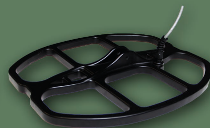
38x30 cm 2D