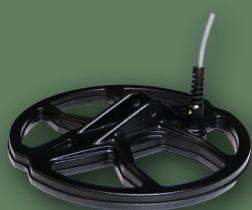
23 cm 2D Spider