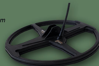
Sonda 33 cm 2D Fighter