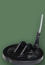
12 cm 2D Spider

LP ZERO II je dodáván v základní verzi se dvěma typy sond 24 cm 2D Fighter a 33 cm 2D Fighter. K dispozici je ale celá řada dalších sond vyráběných pro LP ZERO II společností Golden Mask.