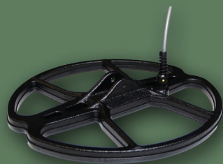
30 cm 2D Spider