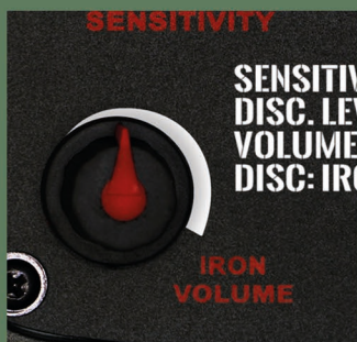
Nová funkce Iron Volume